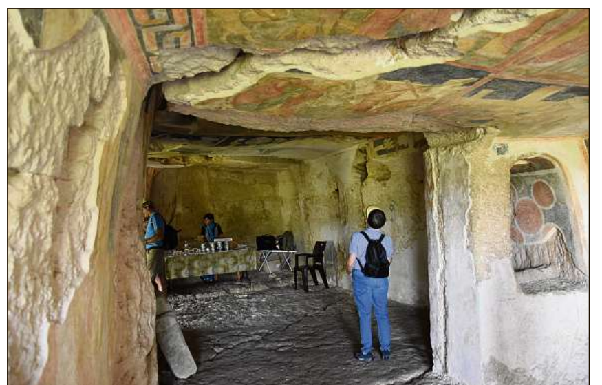
Las baselgias el grep dad Ivanovo raquentan da temps daditg vargai.