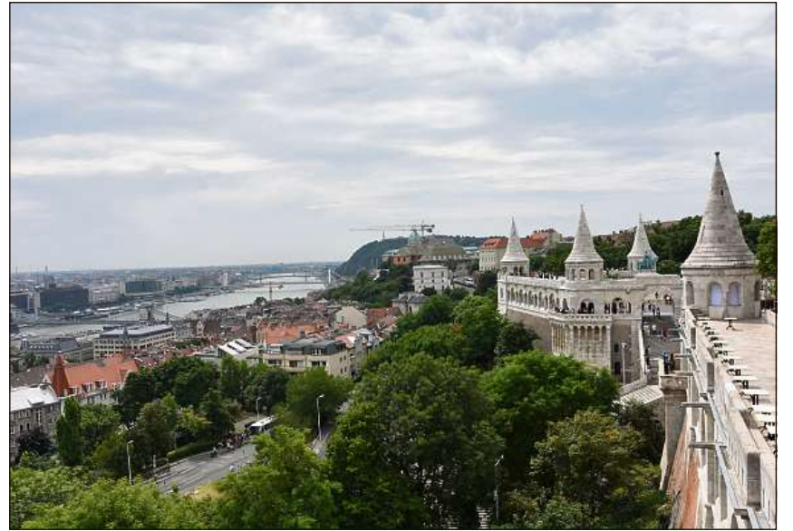
Il flum Danubi sparta il marcau ellas parts «Buda» e «Pest».

Ulteriuras informaziuns e prospects: www.rivage-flussreisen.ch