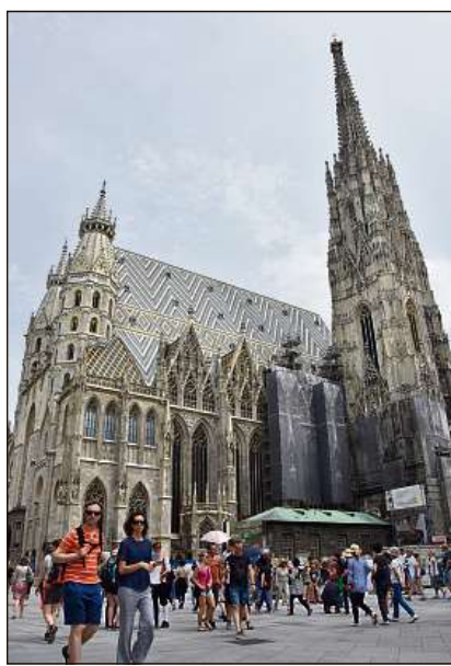
Sil viadi culla cruschera da Passau tochen el Delta dil Danubi ha l'emprema excursiun menau el bellezia marcau da Vienna cul Stephansdom.

Vienna ei stau igl empem marcau che nus havein visitau ed il scharm da quei marcau cun tut sias facetas ha fascinau e fatg gust sin dapli. Oravontut il marcau