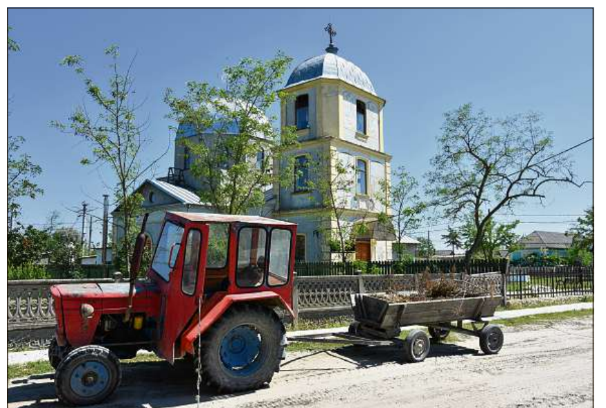
A St. Georg sper la Mar nera paran las uras dad ir empau pli plaun che tier nus.