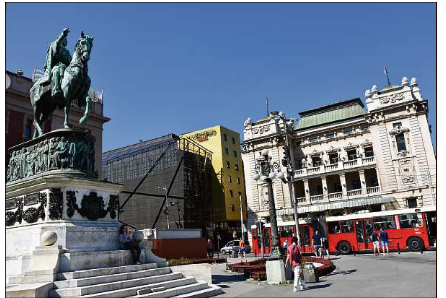
Belgrad en Serbia ei in dils pli vegls marcaus dall'Europa.