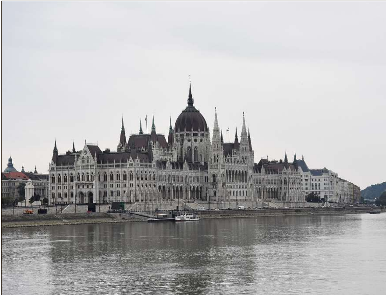
Budapest ei in marcau fascinont cun bia baghetgs el stil baroc.