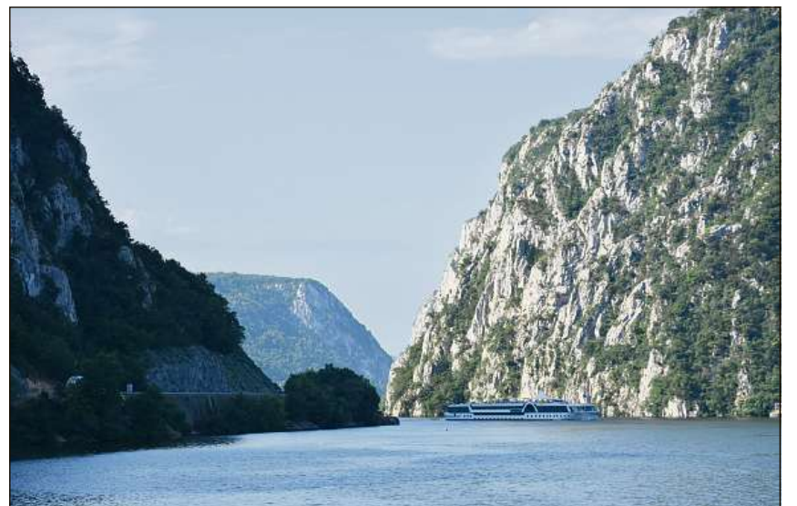
El parc naziunal drova ei tut l'attenziun dils capitans per navigar segiramein tras las stretgas stortas dil Danubi ch'ei sefiritgaus duront mellis onns tras ils cuolms.